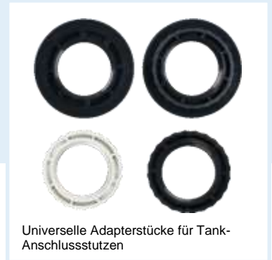
Universelle Adapterstücke für Tank-Anschlussstutzen